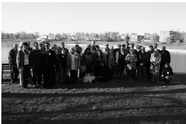
Vereinstreffen Baja, 6. November 2010 / Egyesületi találkozó, Baja, 2010. november 6.