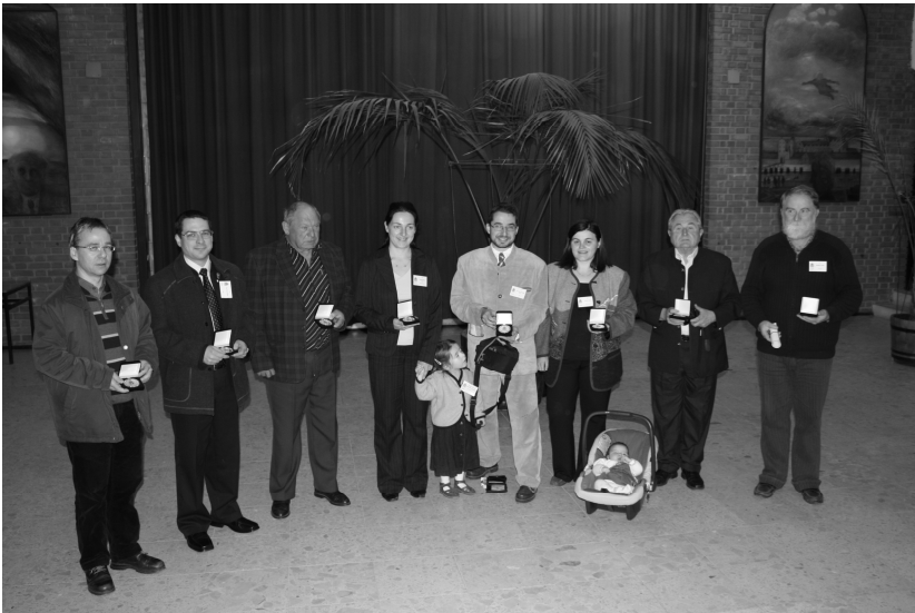
Die Gründungsmitglieder und die zwei AKuFF-Babys

Die Computertechnik hat viele neue Änderungen gebracht für die Familienforschung, die Daten können dadurch viel besser gespeichert werden, doch die mühsame Suche in den Matrikelbüchern kann noch nicht vollständig durchs Internet ersetzt werden, aber vielleicht ist das die Zukunft dieses Hobbys und lockt dadurch einmal doch mehr junge Leute an.