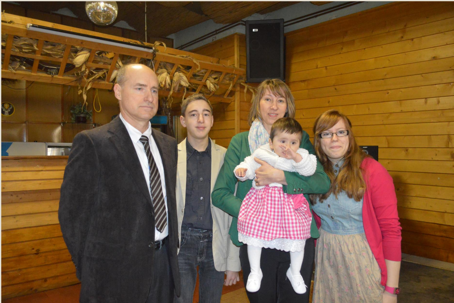
A családom most: a lányom, vőm és a két nagy unoka. A kicsi a fiam kislánya. Lányom a családjával Németországban Wernauban/Stuttgartnál él