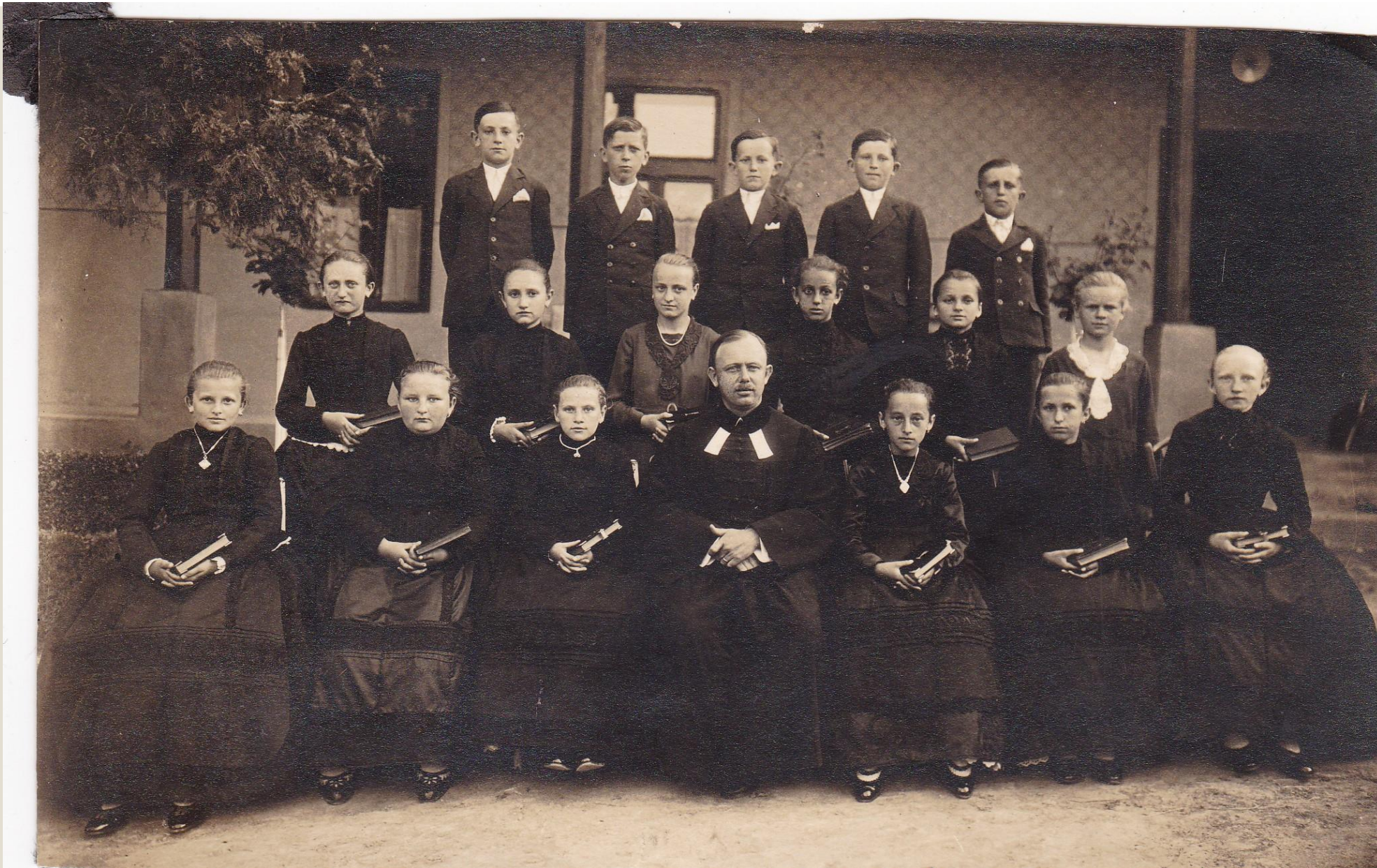
1922-ben született konfirmandusok (evangélikus vallásúak)